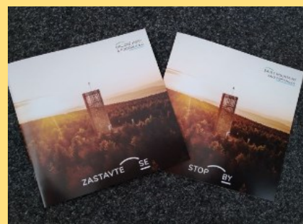
IMAGE brožura OHP

Agentura Czech Tourism vzdělává oblastní organizace destinačních managementů pomocí online seminářů Akademie marketingu CR zaměřených na Trendy 2022, Kreativní brand building, budování značky . V průběhu října probíhají další školení z této série Grow with Google.