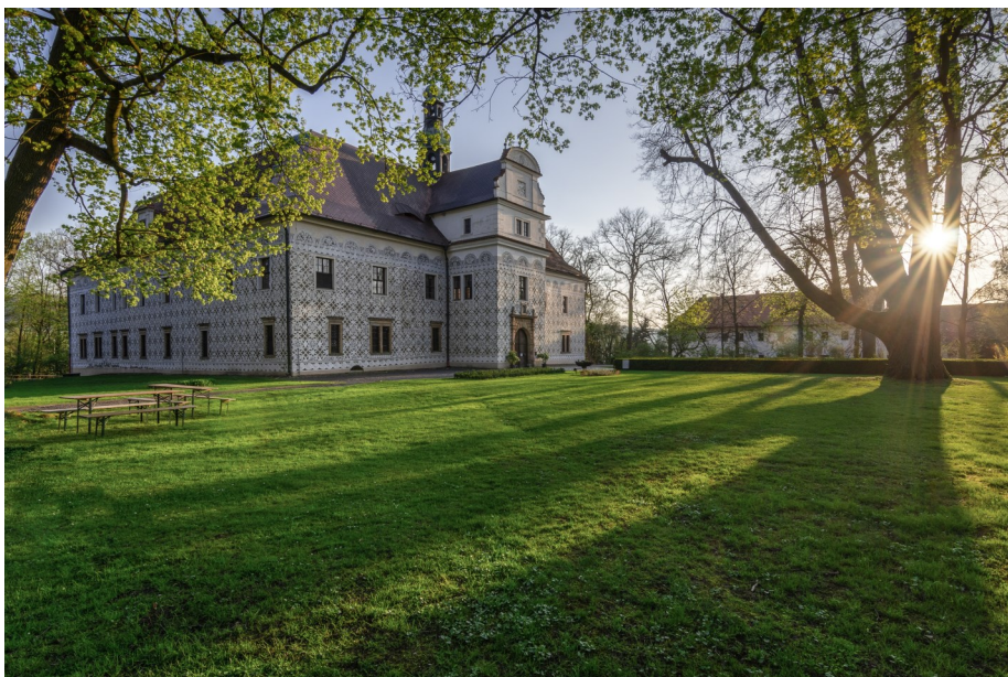
Zámek Doudleby nad Orlicí