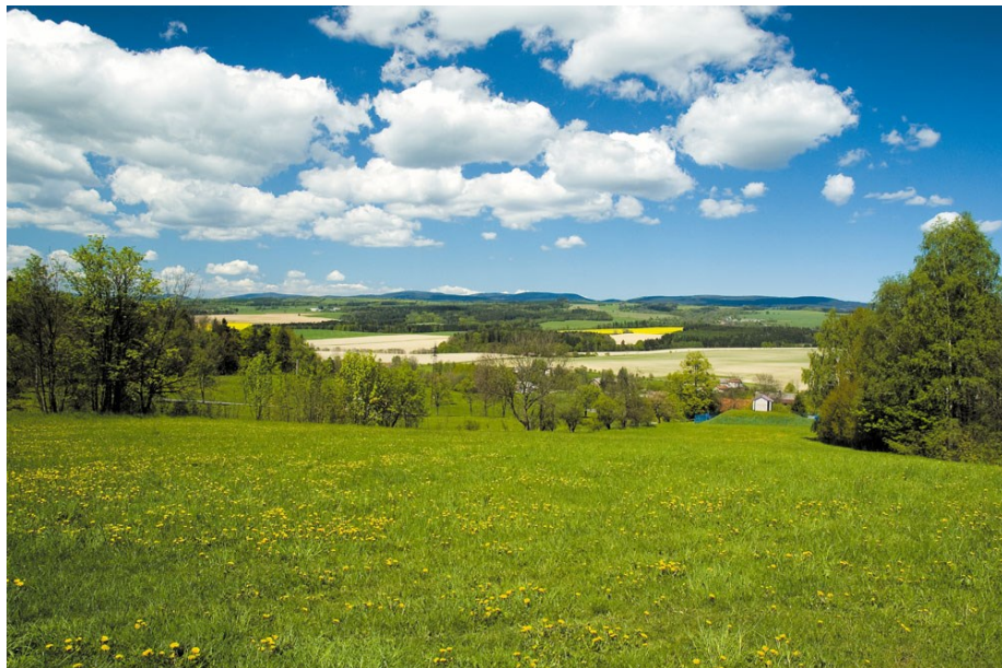
Pohled na Orlické hory z Javornice

Další výstupy pak nepřehlédněte v sekci Napsali o nás .