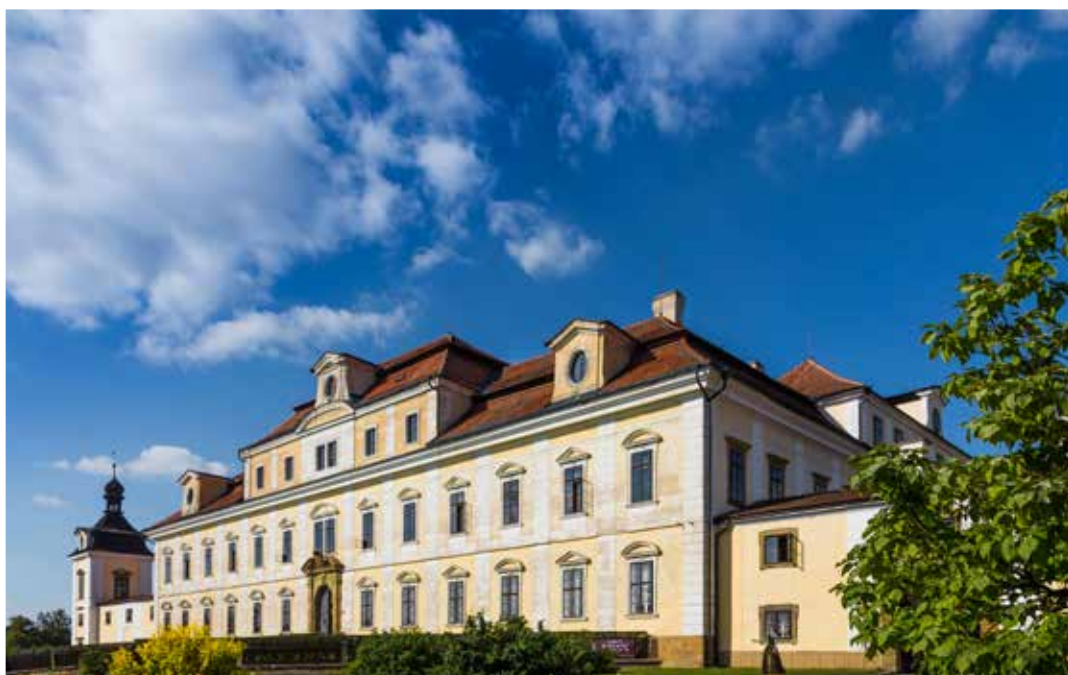
Kolowratský zámek Kolowratská 1, 516 01 Rychnov nad Kněžnou tel. +420 605 267 238 | pokladna-zamek@kolowrat.com | www.zamekrychnov.cz