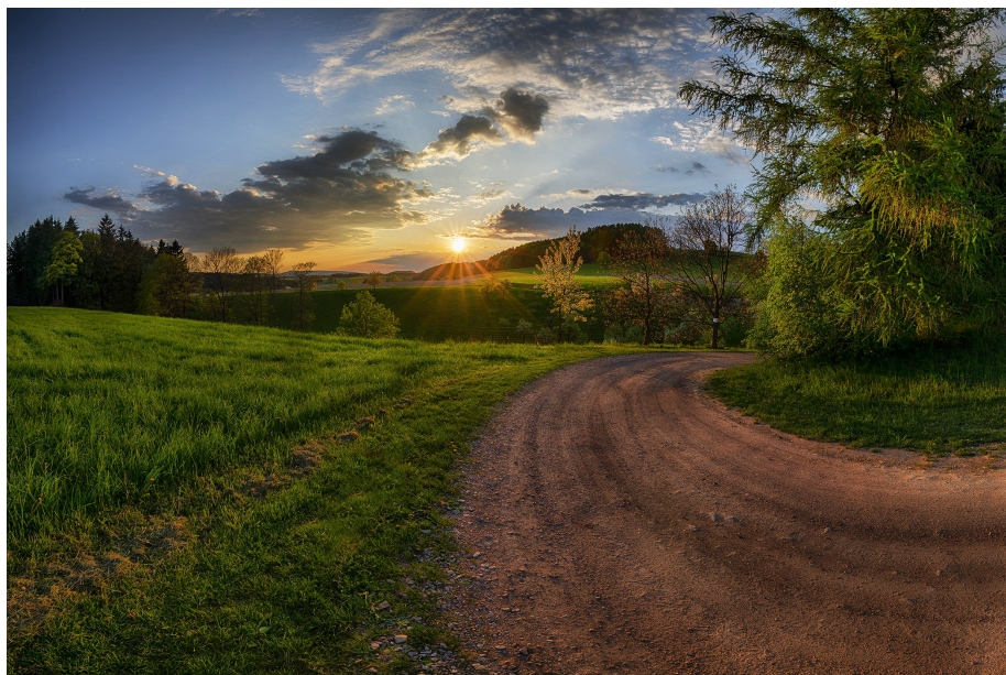
Západ slunce nad Zakopankou (na půli cesty mezi Žamberkem a Kláštercem n.O.)

Další výstupy pak nepřehlédněte v sekci Napsali o nás .