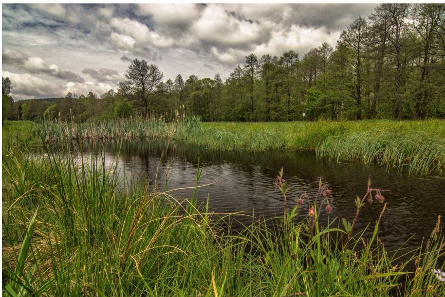
Přírodní rezervace Neratovské louky