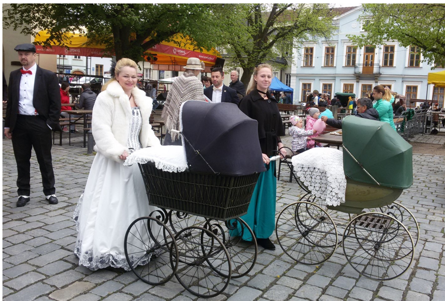
Lázně Ducha v Litomyšli