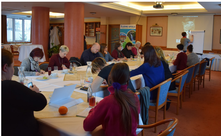
Kurzy polštiny v April hotelu Panorama