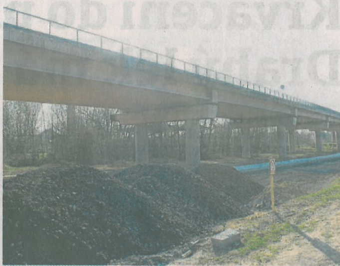
MOST u Hořic bude uzavřen zítra, kdy má začít jeho demolice. Objízdna trasa vede obousměrně přes Hořice.

Demolici a stavbu mostu na obchvatu Hořic provede firma M – Silnice za 269 milionů korun. Necelého půl kilometru dlouhý most byl vybudován v roce 1979, zásadní rekonstrukci si prošel v roce 1994.