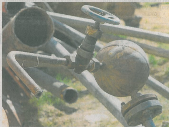
PŮVODNÍ PARNÍ rozvody nahrazují horkovodní.

S výstavbou horkovodní sítě je úzce spjatá dlouho očekávaná rekonstrukce páteřní komunikace v centru města, kterou připravuje Údržba silnic Královéhradeckého